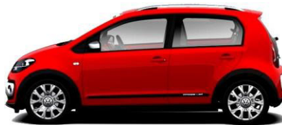
z.B. VW Up!