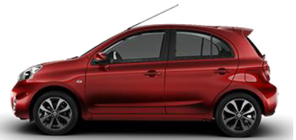
z.B. Nissan Micra

Kostenlos bekommt man das alles, wenn die Feuerversicherung die Prämien wegen nunmehr besseren Brandschutzes entsprechend senkt. Sprechen Sie einfach mal darüber.